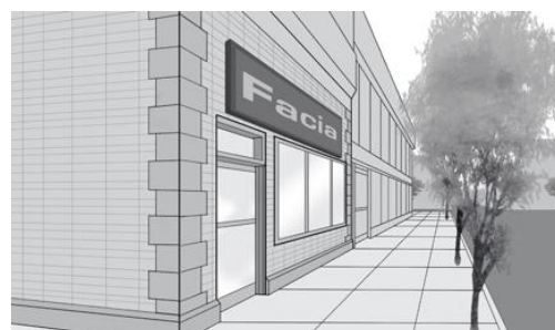
Enseigne en entablement