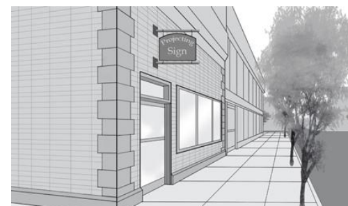
Enseigne en saillie