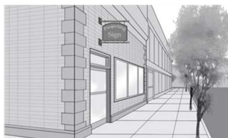
Enseigne en saillie