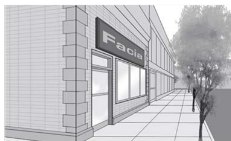
Enseigne de façade