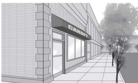
Enseigne sur marquise