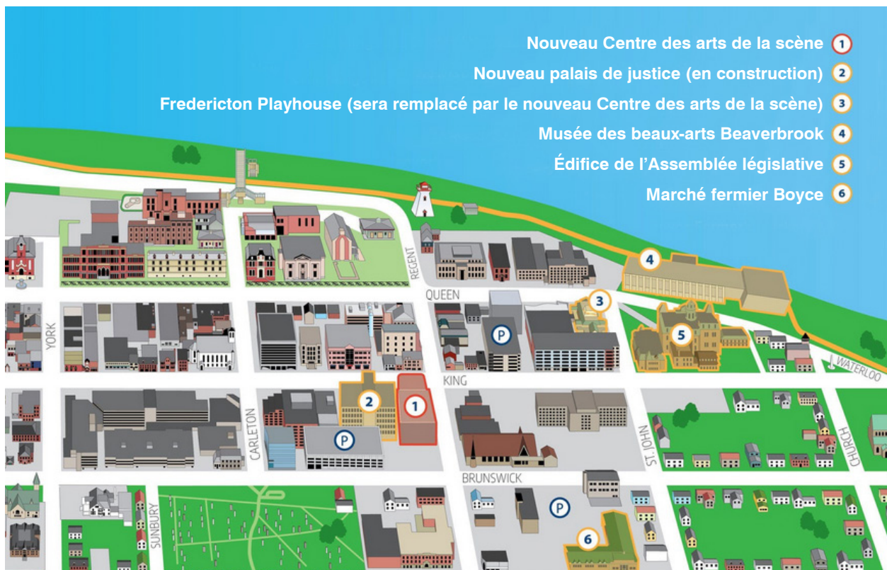
Carte de l'emplacement du nouveau Centre des arts de la scène

Avec son entrée sur la rue King et sa façade s'étendant jusqu'à la rue Regent, le Centre des arts de la scène sera idéalement situé au cœur du centre-ville de Fredericton, à proximité du quartier historique de la Garnison, du Musée des beaux-arts Beaverbrook, de l'édifice de l'Assemblée législative, d'un parc de stationnement, de restaurants, d'établissements hôteliers, de boutiques, de services et d'institutions culturelles.