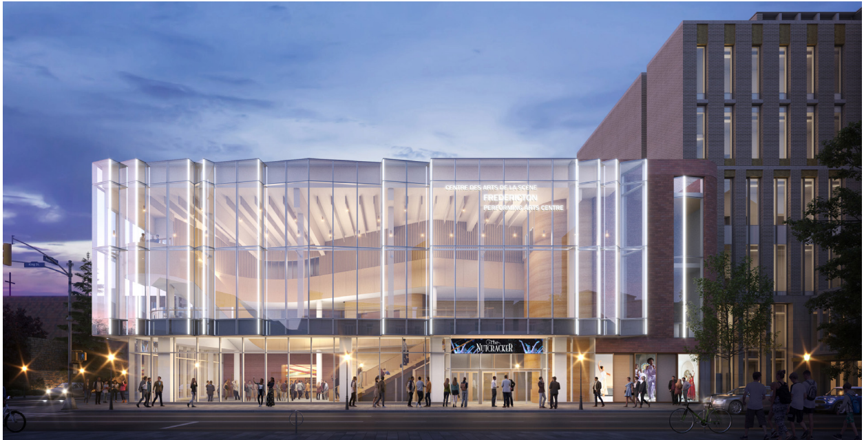
Vue du Centre des arts de la scène depuis la rue King