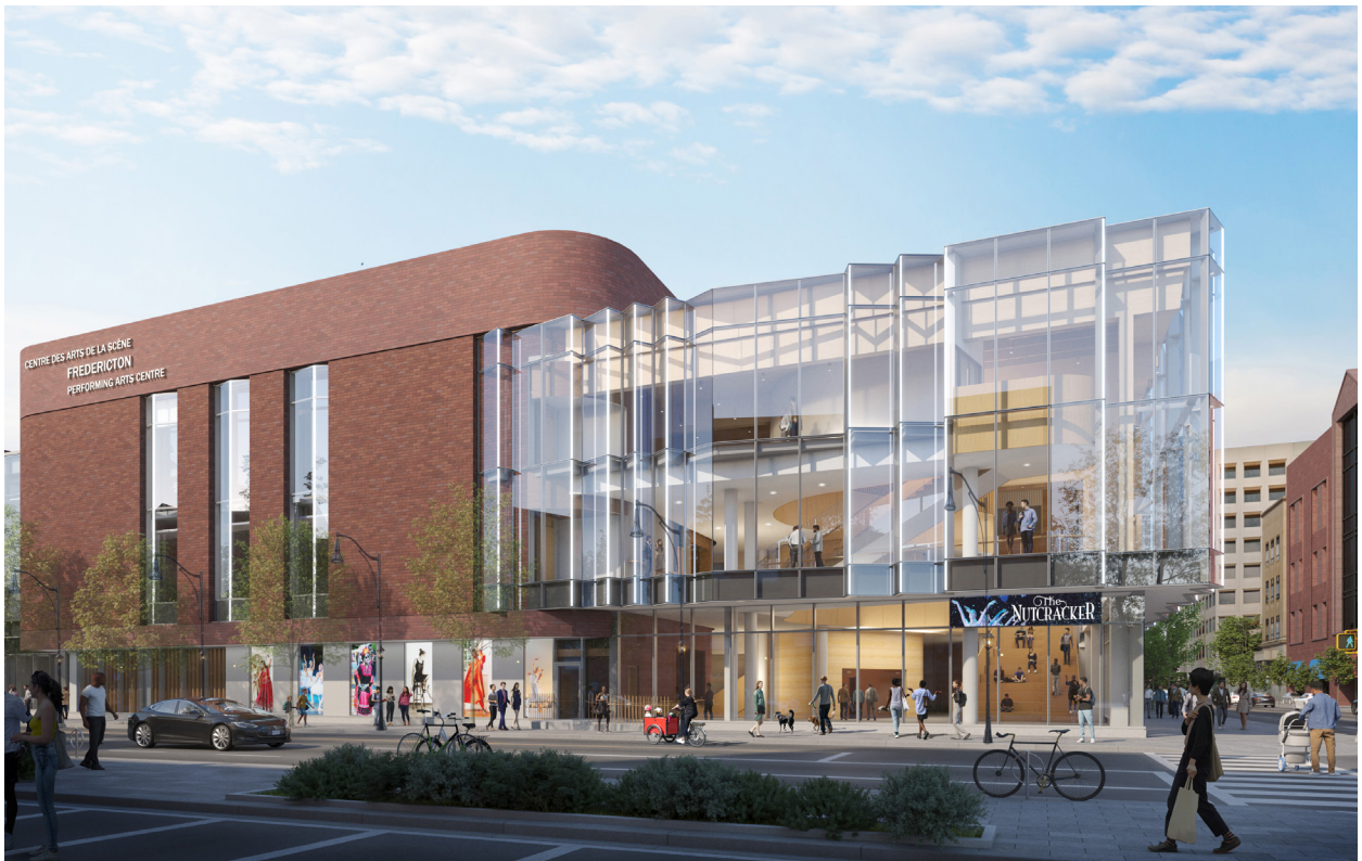
Vue du Centre des arts de la scène depuis la rue Regent