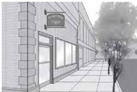
Enseigne en saillie