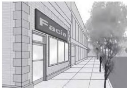
Enseigne de façade