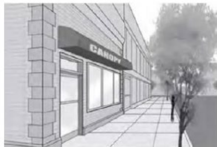
Enseigne sur marquise